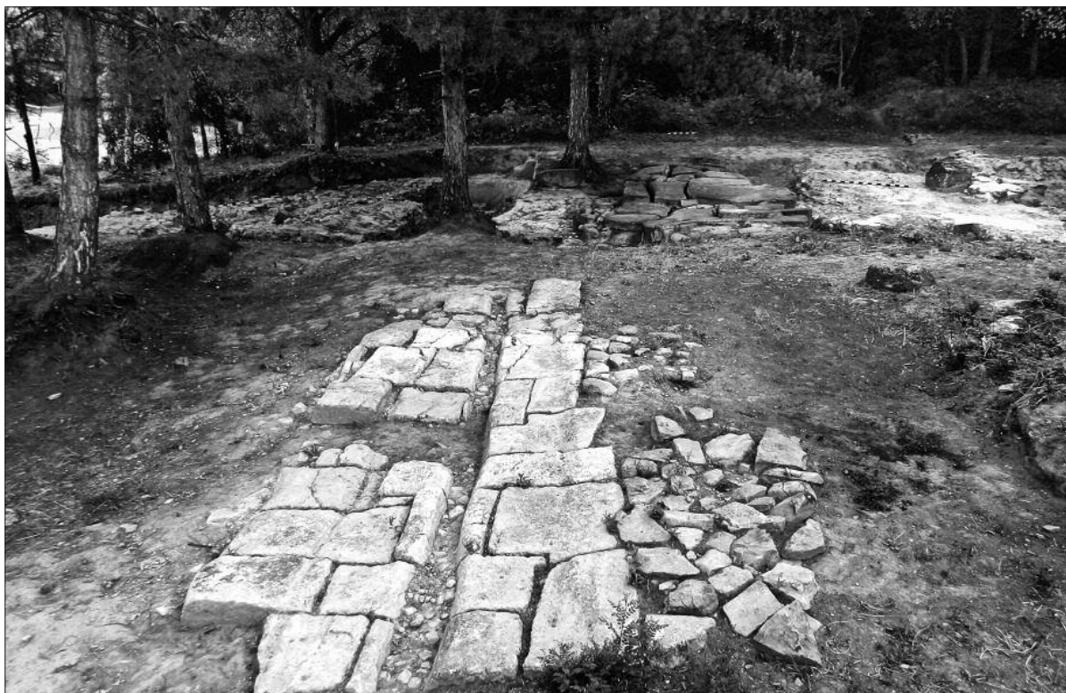
Fig. 1. Novae 2012. Via principalis and the remains of the eastern gate, looking east.

Ryc. 1. Novae 2012. Via principalis i ruiny bramy wschodniej. Widok od zachodu.