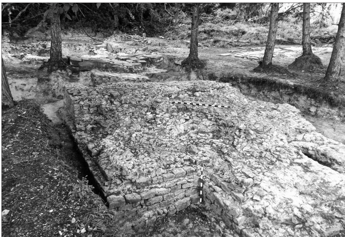
Fig. 2. Novae 2012. The remains of the eastern gate, looking south-west.

Ryc. 1. Novae 2012. Via principalis i ruiny bramy wschodniej. Widok od zachodu.