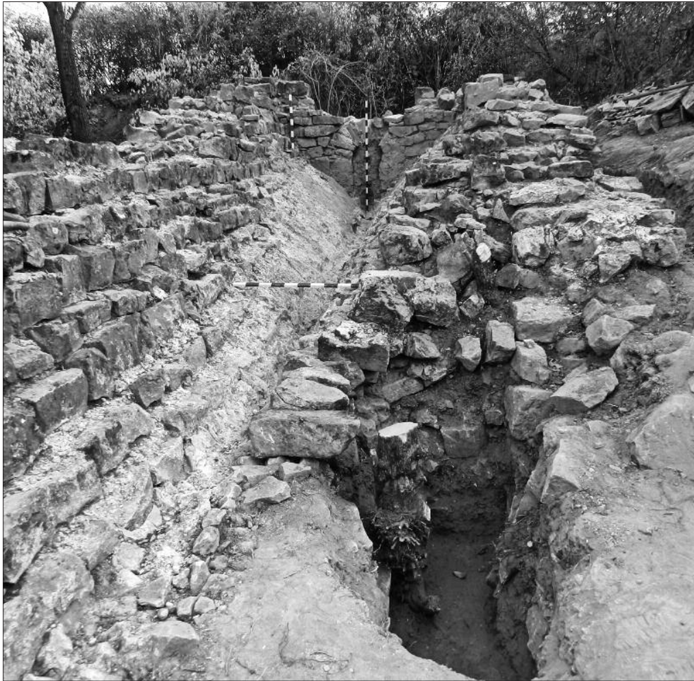
Fig. 4. Novae 2012. The remains of the water tank in the eastern intervallum , looking south.

Ryc. 4. Novae 2012. Zbiornik na wodę w intervallum wschodnim. Widok z północy.