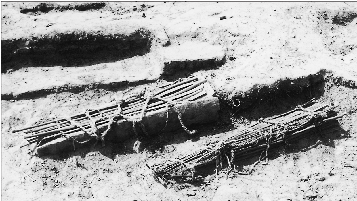
Fig. 4. Trumny: dziartytowa oraz z desek palmowych z dziartytowym wiekiem odsłonięte w nawie kościoła (groby T. 94, T. 95).