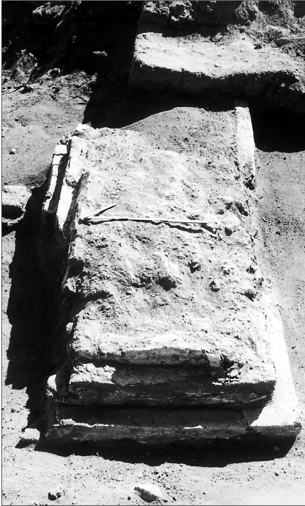
Fig. 2. Średniowieczny nagrobek ceglany (mastaba) – grób T. 60.