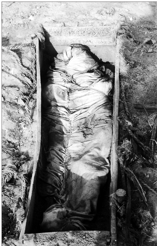
Fig. 5. Zwłoki zawinięte w całun zeszyty „na okrętkę” i przewiązany krajką (grób T. 44).