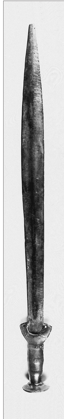
Fig. 2. Brązowy miecz typu liprowskiego z Kobiernic, pow. Bielsko-Biała, woj. śląskie.